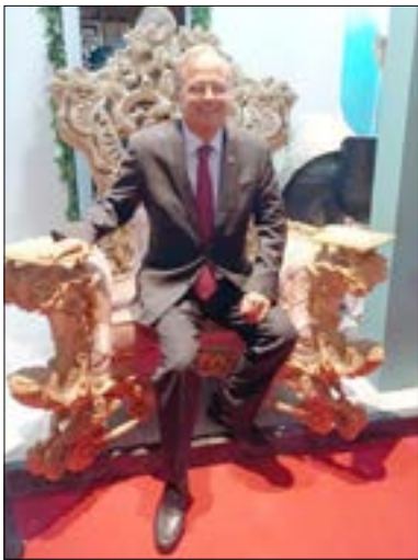
بازارهای هدف و افزایش تعاملات در صنعت گردشگری میشود.