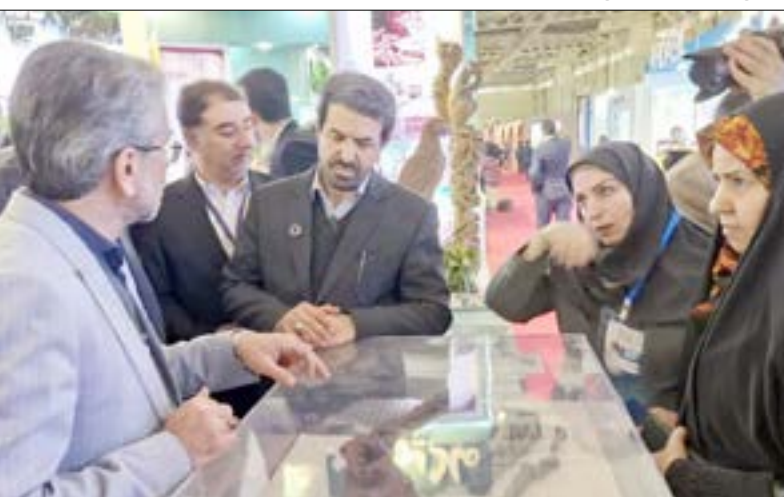
رونمایی از ماکت و کلیپ جدید نوشیجان در نمایشگاه گردشگری تهران

حضور موفق ملایر در هجدهمین نمایشگاه بین المللی گردشگری تهران به عنوان دبیرکل بومی ملایر معرفی شد و بر اهمیت توسعه همکاری های منطقه ای در حوزه گردشگری تأکید گردید. این غرفه با ارائه آثار شاخص و معرفی قابلیت های گردشگری شهرستان، مورد توجه بازدیدکنندگان داخلی و خارجی قرار گرفت.